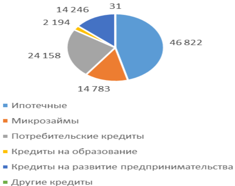
Остатки кредитного портфеля банков Узбекистана физическим лицам (на 01.02.2023)*